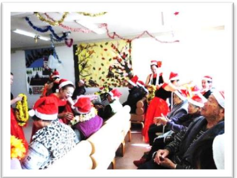
フラの皆様からレイをかけて頂く利用者様

平成28年12月18日、今年もクリスマス会を開催させて頂きました。今回はプレゼントをただ配布するのではなく、お一人お一人に連想ゲームで答えて頂き、正解されたらプレゼント用の番号カードを一枚ひいて頂き、そのひいた番号のプレゼントを受け取って頂く形にしました。プレゼント自体も全部同じではなく、大きさもラッピングもすべて違ったため、各自楽しんで頂けたのではないかと思います。またその後のフラダンスは、色とりどりの衣装と美しいメロディーや優雅な舞はもちろん、ダンサーの皆様も魅力的なうえフレンドリーで、参加された皆が喜んで下さったように思います。それからこれはスタッフも嬉しかったのですが、このところベッドで休まれていることが多くなられた当苑最年長の利用者様も、当日急きょリクライニング車椅子にて参加して下さい、最初は眠そうだったのですが途中目覚められ、フラダンスの演技終了後一緒に拍手をして下さいました。多くの方と楽しいひと時が過ぎて、とても嬉しく思います。