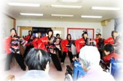
鳴子踊りの粋な演技