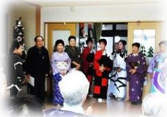
妻沼民謡民舞の皆様

10月4日は妻沼民謡民舞の演技、10月12日は鳴子踊りの演技をご覧になられました。どちらも華やかな衣装に、時には優美時には粋な舞を音楽とともに楽しまれたご様子で、音楽に合わせて拍子を取られている利用者様もいらっしゃいました。また10月31日には利用者様の弟様が、小話と歌を聞かせて下さいました。どれも楽しくて、時間があっという間に過ぎました。