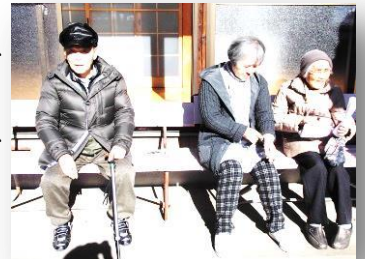
太田神社でくつろがれる利用者様

元旦には、例年通り近所の太田神社に初詣に出かけられました。今年は寒かったせいでしょうか、例年よりご参加下さる方が少なく、それがとても残念でした。また太田神社では、毎年甘酒とみかんを頂いていますが、今年も楽しまれたご様子でした。あと皆様太田神社の神様に、何かお願い事をされたのでしょうか。皆様の願い事すべてが、どうか叶いますように！そして来年はもっと参加人数が増えますように！！