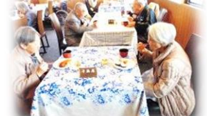
グルメロードでの利用者様