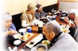
がってん食堂 大島屋での利用者様

10月28日はがってん食堂 大島屋に、11月30日にはグルメロードに外食に出かけられました。また今年の1月は、外食ではありませんが、1月生まれの利用者様のお誕生会を兼ねて、一美寿司を昼食に召し上がられました。いつもは食の進まない利用者様も、このときばかりはあっという間に召し上がられて、スタッフを驚かせて下さったりします。どの日にしましても、皆様おいしい、おいしいと召し上がられて、とても喜んで下さったように思います。